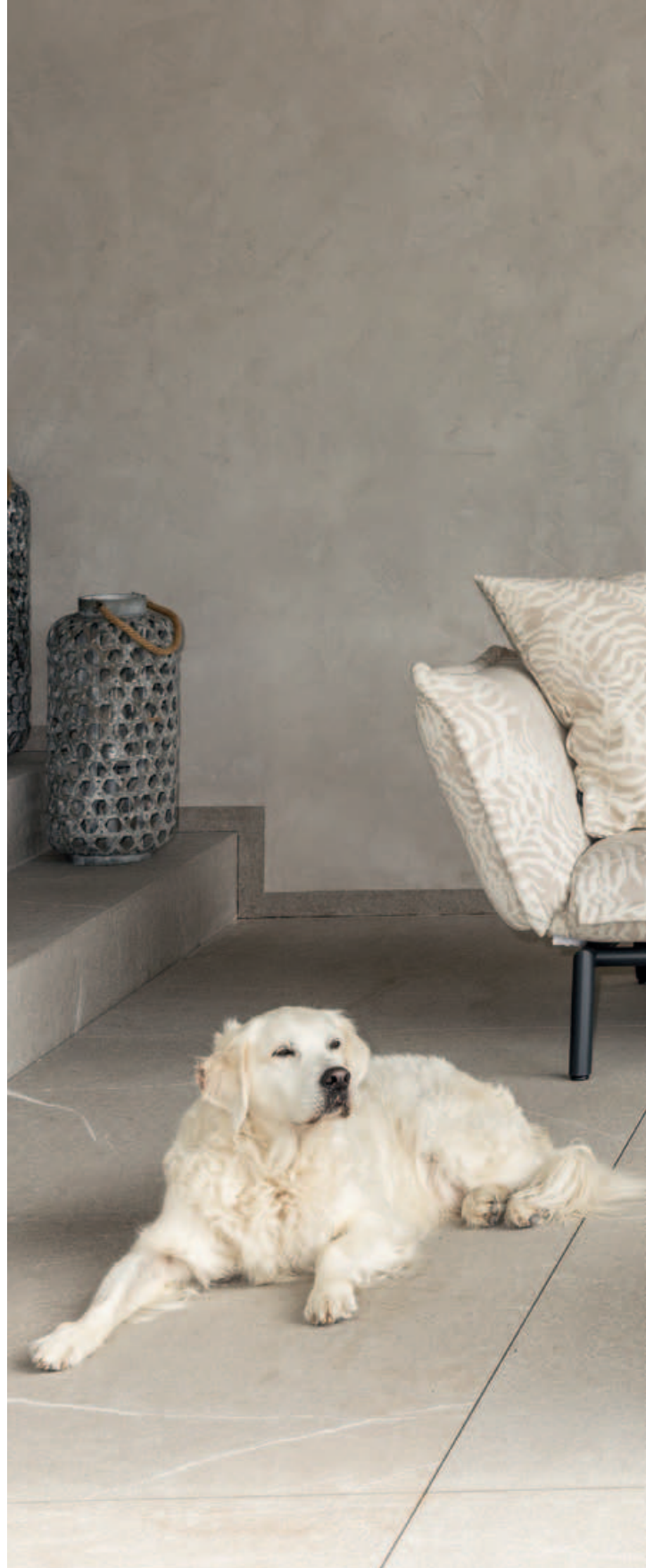
Collections Luna, Claris