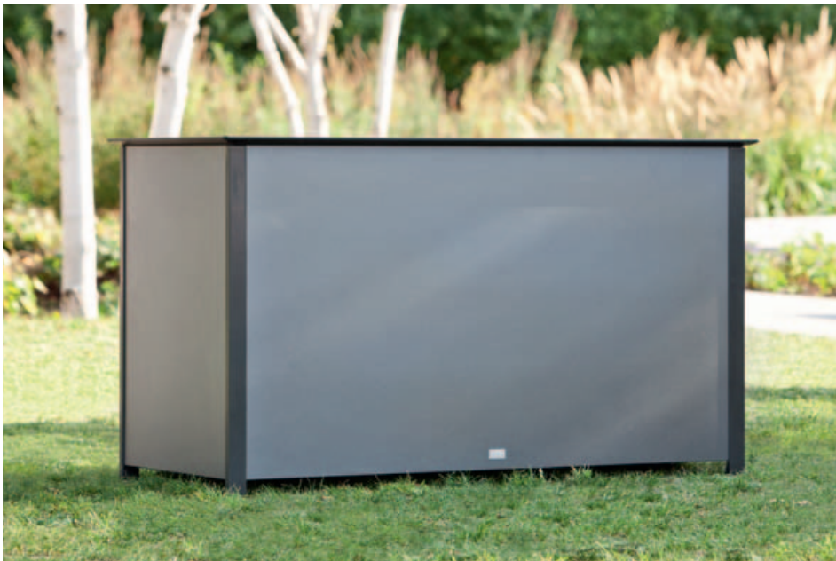
Collections Woodline, Cushion box, Aluline