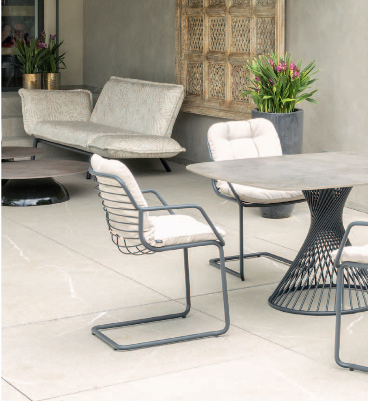
Collections Luna, Fungo, Claris, Riva